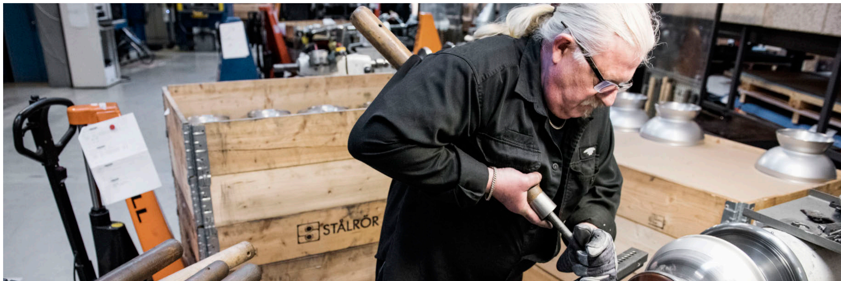
OPSPARING. Hvis politikerne vil sikre, at danskere tæt på pensionsalderen skal have et incitament til at spare op, er der brug for et politisk opgør med den nuværende situation, hvor folk er til grin for deres egne penge, hvis de sparer op.