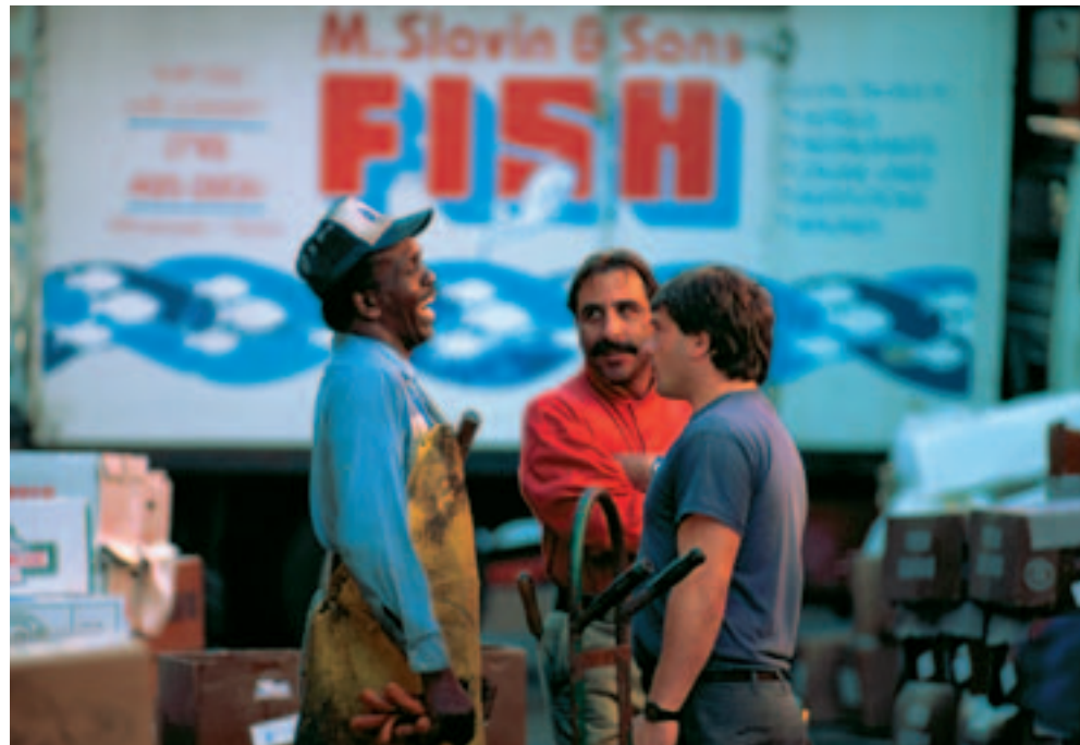
Fulton fishmarket, New York.

On the basis of these introductory sessions, classes consider both the US and the countries of Latin America. Coverage of the US begins in 1929 and