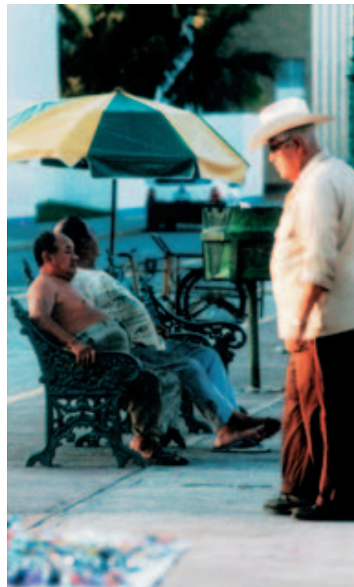
Veracruz, Mexico.

Det er et faktum, at dansk erhvervsliv traditionelt har vist meget lille interesse for Latinamerika. Det er typisk de store, internationalt orienterede virksomheder der er til stede her, som de er det i det meste af verden. Relativt få virksomheder har vist særlig interesse for regionen. Et eksempel er Christian Hansen med sine omfattende aktiviteter i Argentina og Brasilien. Ligeledes har enkelte små og mindre virksomheder satset på markeder i Latinamerika. Sammenligner man med andre verdensdele, fremgår det klart, at Latinamerika er et overset kontinent. Danske virksomheder har langt mere omfattende interesser i Asien, og deres aktiviteter i Afrika – der er et væsentligt mindre marked end Latinamerika – er lige så omfattende som i Latinamerika. En del af forklaringen ligger givetvis i de førnævnte typiske danske forestillinger om Latinamerika. Selv om man kan gennemskue deres begrænsninger, betyder de ofte, at mange erhvervsledere slet ikke overvejer muligheden af etablering i Latinamerika. En anden