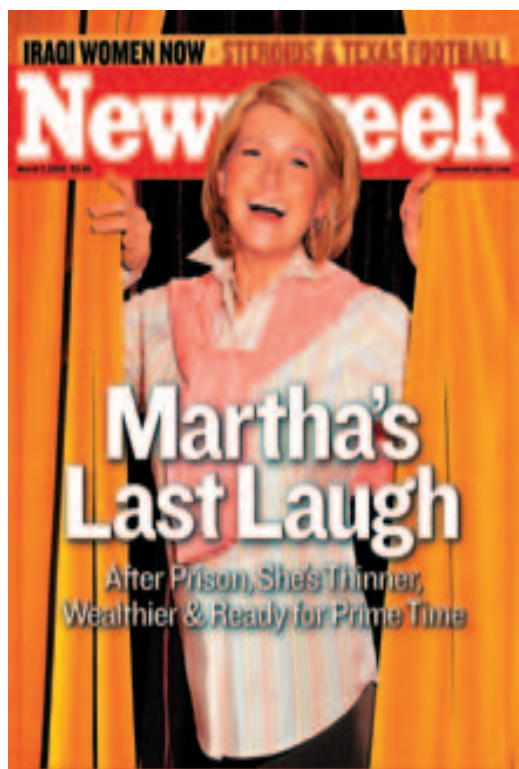
Newsweek cover with Martha Stewart – sort of...