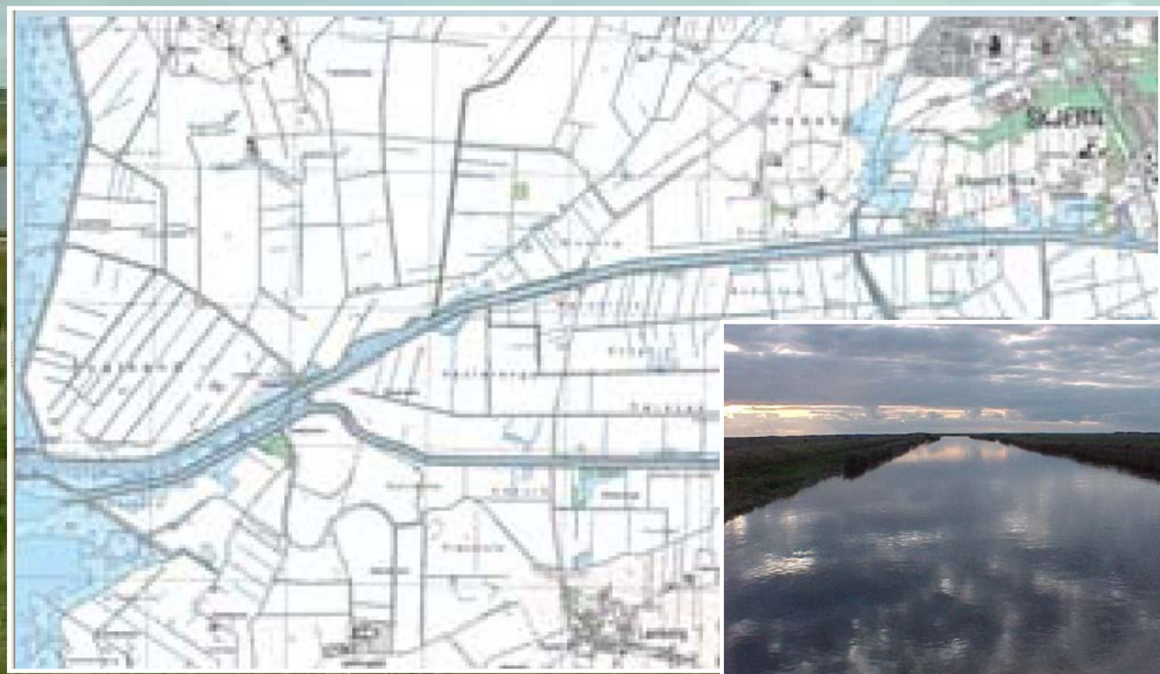
Kortet er fra 1992 - efter udretningen